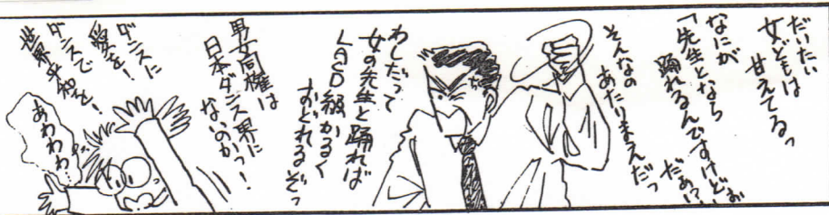
ダンスファン 「おしゃべりDANCE」から

一月一日施行の風俗営業 法改正に関連して、JADA 登録サークルとしての体 制を整えたものです。そ して、もうひとつの公認 指導員も、新年には登場 することになる予定です。 役員には従来の役員に 加え、監事も含めて9名 体制で、これからの二年 間お世話役を勤めること になりました。意見やご 希望を役員までお寄せ下 さい。